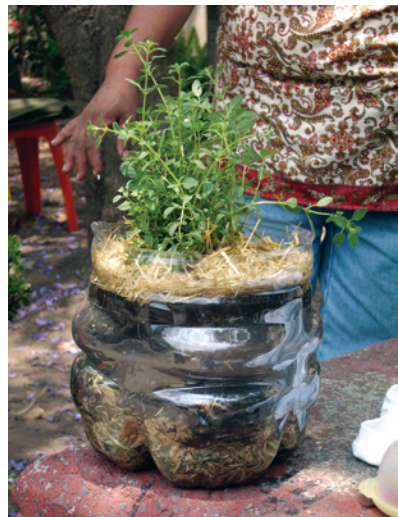
Aprovechamiento de desperdicios para cultivo de hortalizas.

Existen diversos modelos de estufas ahorradoras, algunos más eficientes o de construcción más sencilla que otros, pero todos dan un buen resultado cuando se les utiliza correctamente.