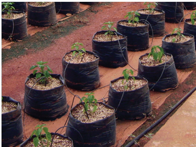
Cultivo de hidroponía en invernadero, Felipe Carrillo Puerto, Quintana Roo.