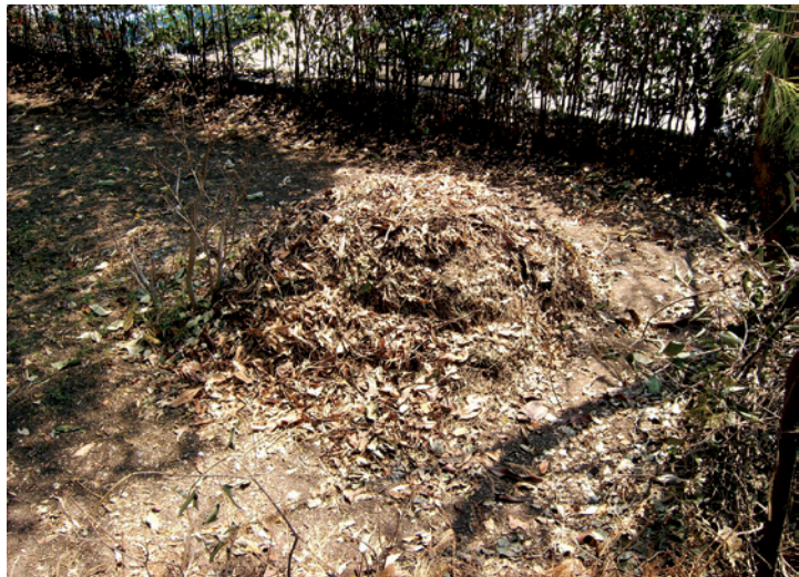
Pila de composta.