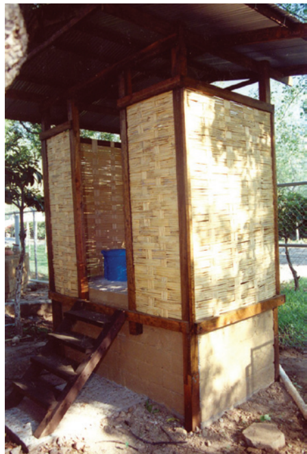
Sanitario ecológico seco en caseta de carrizo.