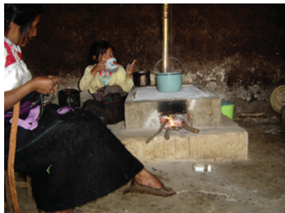
Estufa ahorradora de leña en Chipas.

Ésta es una práctica más o menos extendida en el estado, ya sea en la forma de secadores tipo invernadero o de tostadores para el cacao. Dado que los beneficios económicos aportados por esta tecnología son relativamente evidentes e inmediatos cuando están asociados a una actividad productiva, los usuarios en