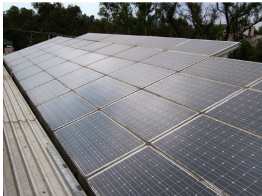
Panel solar, Ciudad de México.