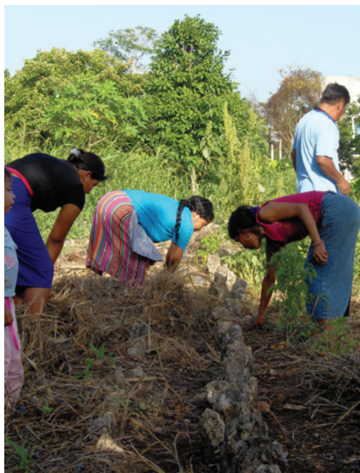
Cultivo de hortalizas, Quintana Roo.

Es necesario aprovechar la alta precipitación de la temporada de lluvias y retener suficiente agua para las secas, de manera que no falte para la comida, la higiene y los cultivos alternativos durante todo el año.