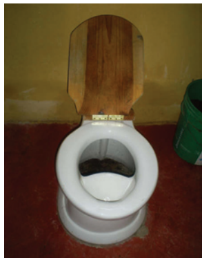
Sanitario ecológico seco.

Nuevamente se observa la correlación entre el grado de capacitación de los usuarios y el seguimiento de la dependencia promotora, con el éxito del proyecto en el mediano y largo plazo.