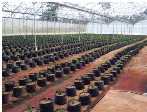
Cultivo de hidroponía en invernadero, Felipe Carrillo Puerto, Quintana Roo.

Ésta es, probablemente, la actividad con TA con mayor éxito entre las detectadas. Específicamente la empresa Hidroponía Maya, con participación gubernamental, ha realizado un importante trabajo que ha dado como resultado no sólo su propio crecimiento, sino también el apoyo a grupos locales mediante los llamados viveros sociales, en donde se presta asesoría técnica a los agricultores interesados en esta alternativa de producción para echarla a andar adap-