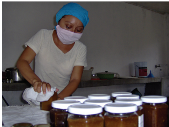
Preparación de conservas, Quintana Roo.

En general la población tiene conciencia sobre lo conveniente que resulta el cultivo sin el uso de pesticidas y agroquímicos. Por otro lado la abeja melipona