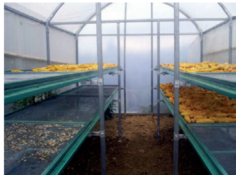
Secadora solar en Chiapas.

Es preciso, sin embargo, abundar en cada tecnología y evaluar sus probabilidades de éxito en cada situación. Recordemos que, por tratarse de opciones no convencionales, son más susceptibles a ser rechazadas si no dan los resultados esperados a sus usuarios en el corto plazo.