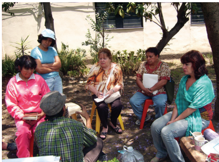
Taller de permacultura

Para asegurar su éxito el proyecto debe garantizar y verificar que los sistemas instalados están siendo usados correctamente por los beneficiarios al