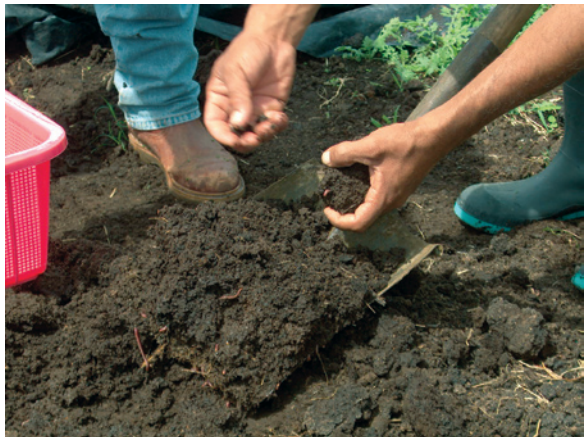
Preparación de lombricomposta.