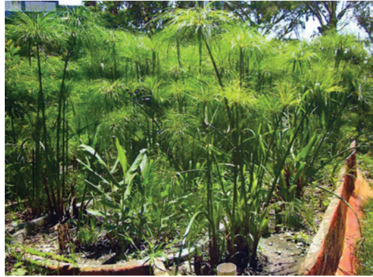
Entramado de raíces.

res donde las condiciones geográficas hacen difícil el tendido de cables de alta tensión para llevar electricidad producida convencionalmente.