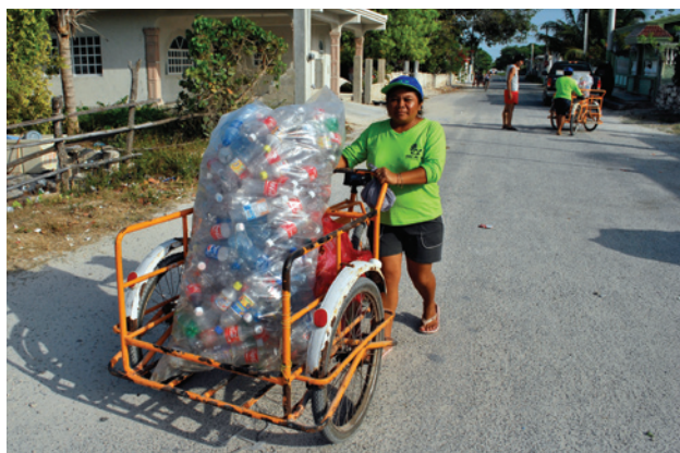
Colecta de PET en Chuburná, Yucatán.

Los grupos están bien organizados, por lo que han obtenido buenos resultados en general, e incluso algunos tienen planes de expansión. Facilitar el apoyo económico para comprar herramientas o ampliar su infraestructura se traduciría en un incremento en los beneficios de estos proyectos.