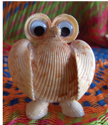
Artesanía elaborada con conchas marinas, San Crisanto, Yucatán.

Otro factor de éxito fue la vinculación de los baños a proyectos productivos, concretamente a centros de ecoturismo, ya que se requiere que se conser-