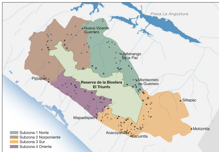
Figura 3. Zona de influencia de la Reserva de la Biosfera El Triunfo, Chiapas, y localidades prioritarias.

municipios e hidrológicos de las cuencas por medio de sus ríos y microcuencas que funcionan como límites naturales, el acercamiento también se basó en la distribución espacial de los asentamientos y su relación con las redes de comunicación terrestres alrededor del polígono de la reserva, ya que por las condiciones topográficas (pendiente, gradiente altitudinal, riesgo de erosión, deslaves, diferentes tipos de vegetación), los elementos de caminos de acceso o de limitación para la relación comunidades-reserva adquieren especial relevancia, como quedó demostrado con el huracán Stan, en octubre de 2005. En este sentido, la red de caminos que rodean la reserva y en algunos casos los ríos se consideran como los factores primordiales para la delimitación de esta zona de influencia.