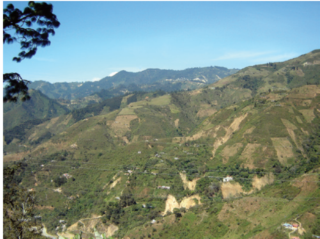
Fragmentación de suelos en la zona de influencia de El Triunfo.

el manejo de la cuenca que forman la Sierra Madre de Chiapas y la Planicie Costera del Pacífico, pues reviste particular relevancia por coincidir con la localización de otra importante Reserva de la Biosfera de Chiapas: La Encrucijada, que protege los ambientes costeros del mismo sistema hidrológico”. 28