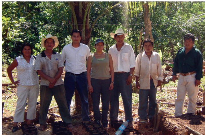
Trabajo con organizaciones sociales de las zonas de influencia.

realizadas a sus representantes se aprecia su conocimiento sobre los temas de conservación de los recursos naturales y que reconocen la necesidad cambiar los sistemas productivos no sustentables, para lo cual requieren el acompañamiento económico y técnico de las instituciones.