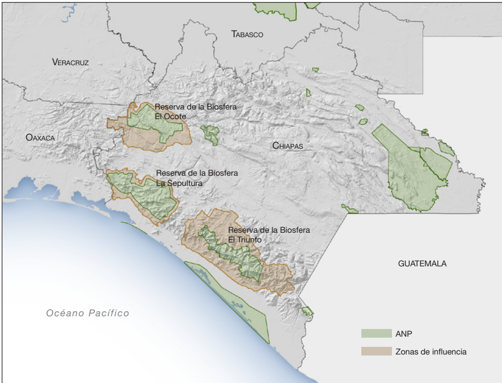
Figura 1. Área de estudio en el CBMM Selva Maya-Zoque y Sierra Madre del Sur, Chiapas.