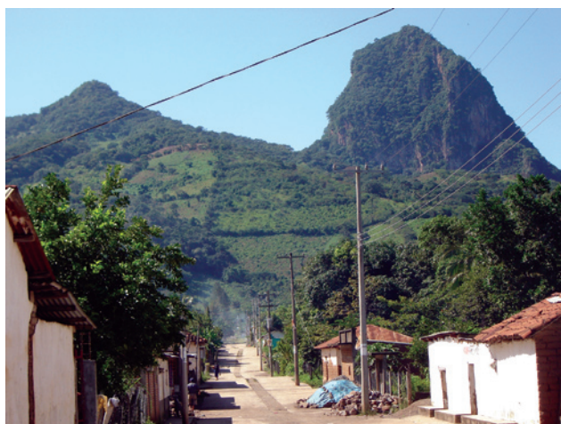
Comunidad El Porvenir, Motozintla, zona de influencia de El Triunfo.

Sólo 1% de la población son hablantes de lengua indígena, de las etnias mame y mochó.