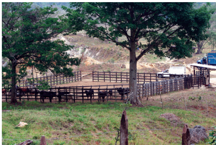
Manejo ganadero en la zona de influencia de La Sepultura.

7. Se identificaron las localidades de atención prioritaria, para lo cual se determinaron los siguientes filtros en la base de datos: 35