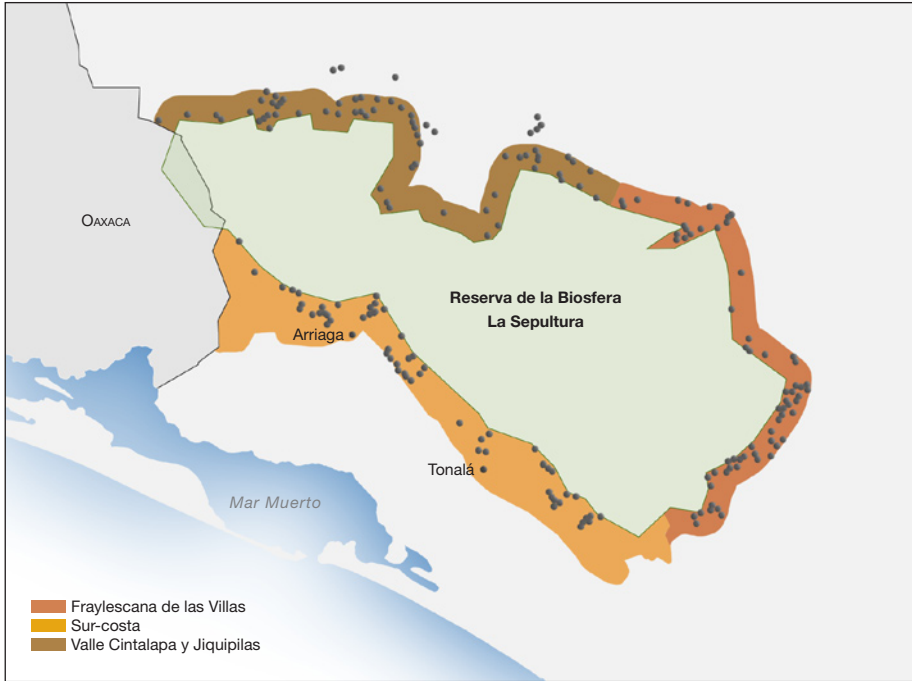
Figura 4. Zona de Influencia de la Reserva de la Biosfera La Sepultura, Chiapas.