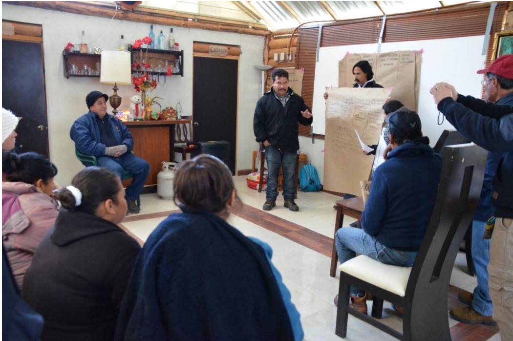
Los participantes propusieron diversas soluciones para atacar la problemática de las EEI en el Parque Nacional Cumbres de Monterrey.

Proyecto GEF-Invasoras_ Servicio de consultoría para la implementación de seis talleres de educación ambiental sobre la problemática de especies exóticas invasoras en el Parque Nacional Cumbres de Monterrey