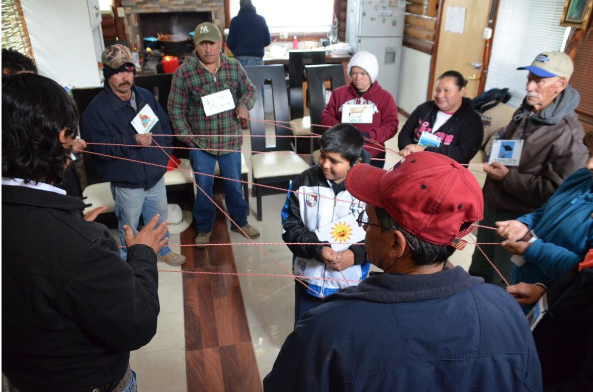
A través de la dinámica "La Telaraña de la Vida" los participantes aprendieron el concepto de ecosistema, además reconocieron los objetos de conservación del área natural protegida y su importancia.

Proyecto GEF-Invasoras_ Servicio de consultoría para la implementación de seis talleres de educación ambiental sobre la problemática de especies exóticas invasoras en el Parque Nacional Cumbres de Monterrey