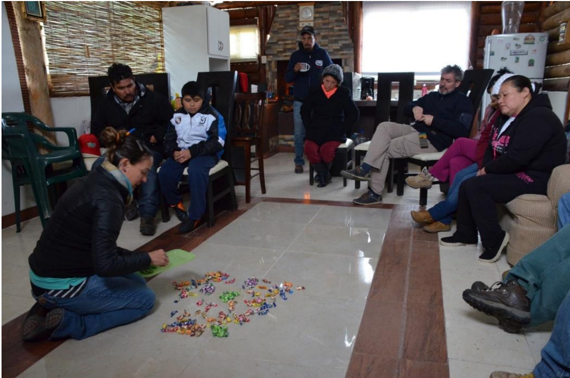
Empleando caramelos y rollos de cinta, los participantes reforzaron el concepto de competencia intra e interespecífica y cómo sucede el desplazamiento de las especies nativas por las especies invasoras en los ecosistemas.

Proyecto GEF-Invasoras_ Servicio de consultoría para la implementación de seis talleres de educación ambiental sobre la problemática de especies exóticas invasoras en el Parque Nacional Cumbres de Monterrey