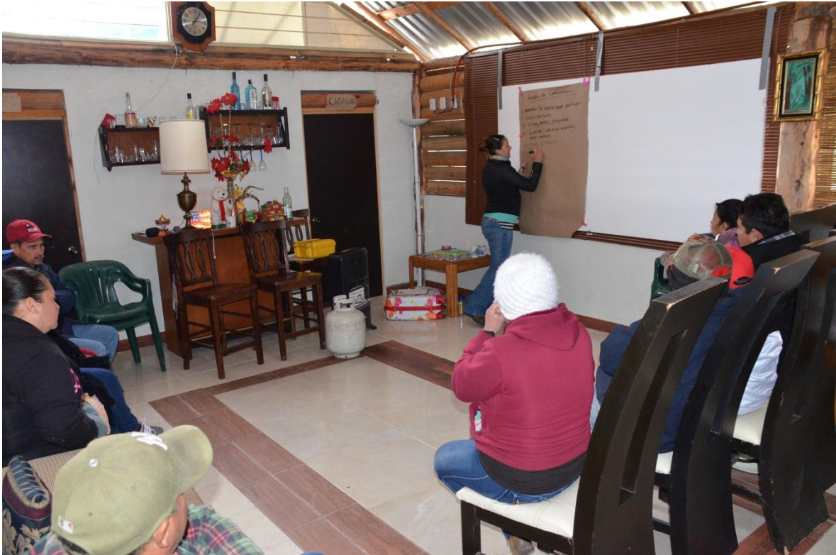
Las personas que atendieron el taller propusieron participativamente las reglas para una sana convivencia y para alcanzar el objetivo del taller de la mejor manera, en un ambiente de respeto y cordialidad.

Proyecto GEF-Invasoras_ Servicio de consultoría para la implementación de seis talleres de educación ambiental sobre la problemática de especies exóticas invasoras en el Parque Nacional Cumbres de Monterrey