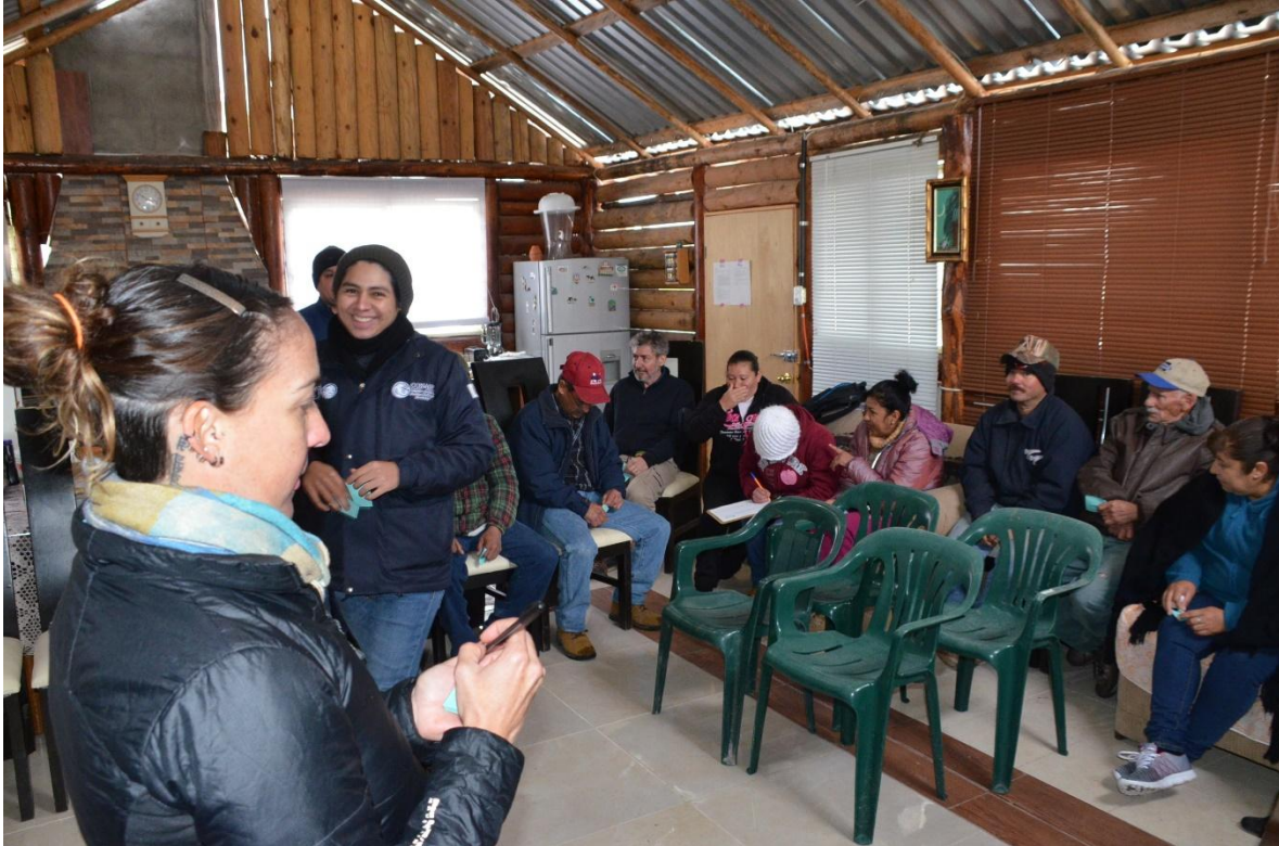
Dinámica de presentación llamada "Encuentre su pareja" en la que los participantes deben encontrar parejas para conocerse, presentarse entre sí, y resaltando la importancia de la comunicación y del logro de metas en un equipo.

Proyecto GEF-Invasoras_ Servicio de consultoría para la implementación de seis talleres de educación ambiental sobre la problemática de especies exóticas invasoras en el Parque Nacional Cumbres de Monterrey