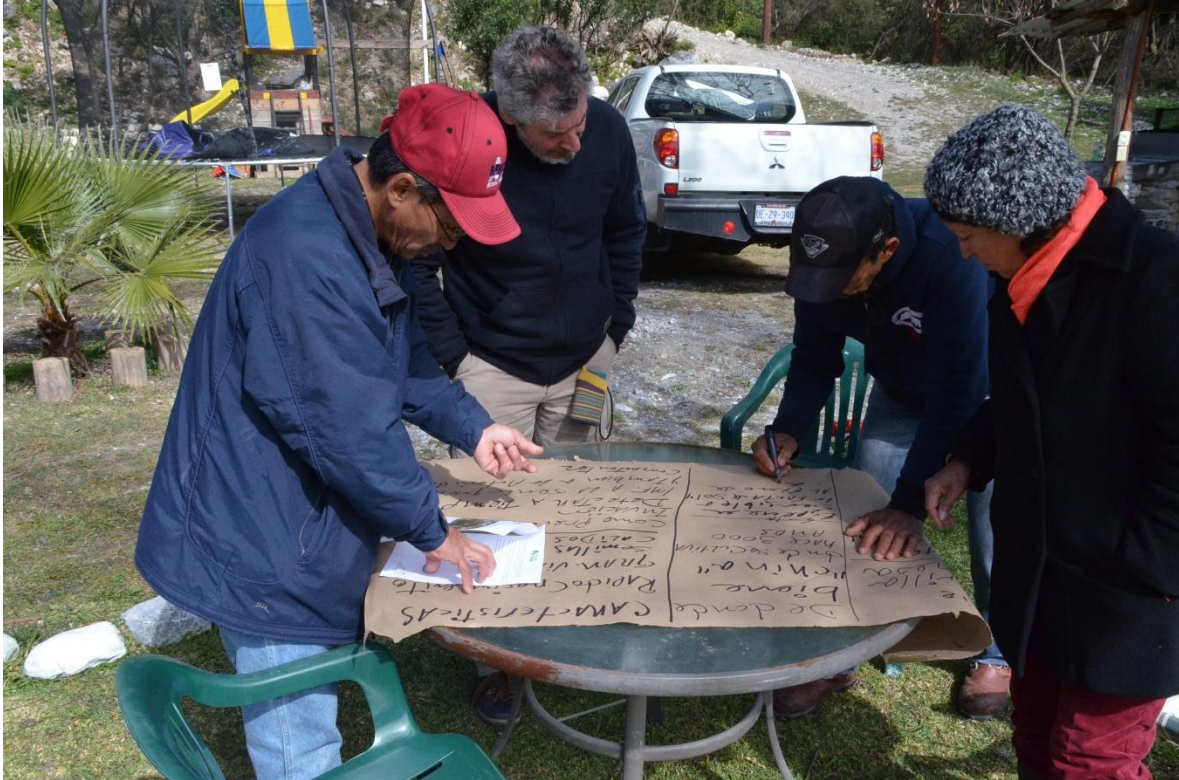
Los participantes aprendieron cuales son las especies exóticas invasoras de su comunidad y la importancia de su control.

Proyecto GEF-Invasoras_ Servicio de consultoría para la implementación de seis talleres de educación ambiental sobre la problemática de especies exóticas invasoras en el Parque Nacional Cumbres de Monterrey